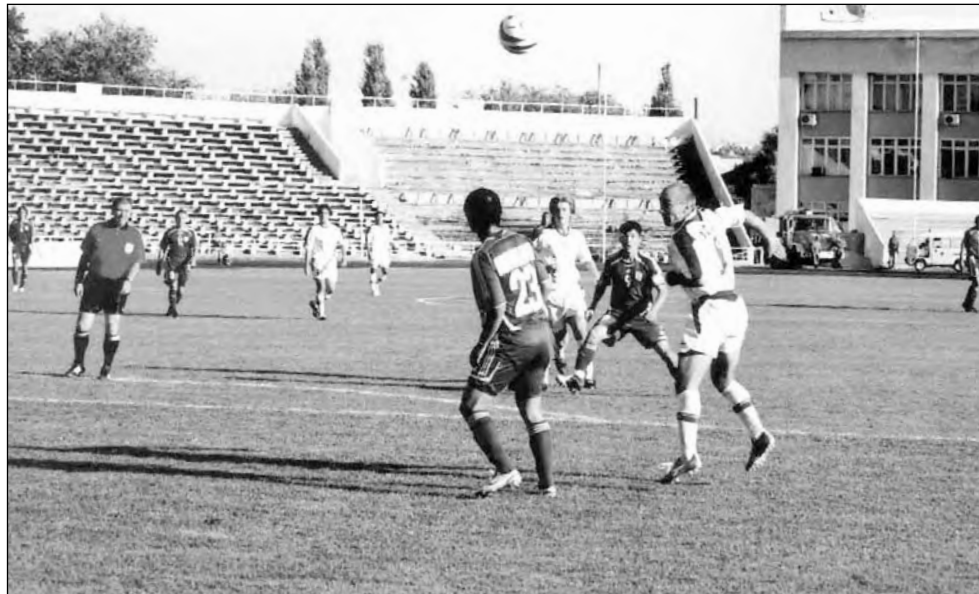
Пустые трибуны для Костаная – картина непривычная

Хозяева смогли создать угрозу воротам Морева ближе к середине первого тайма.