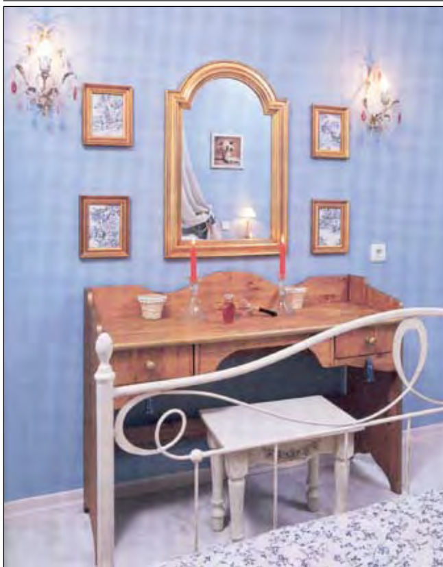
Зеркала в классическом багете с лепниной – «фишка» квартиры. В таком же стиле подобраны рамки для «картинок», вырезанных из ткани шторы. Сюжет – опять же пасторальные сценки

лая, бежево-кремовая. Натяжной потолок зеркально отражает помещение ванной, придавая ему высоту.