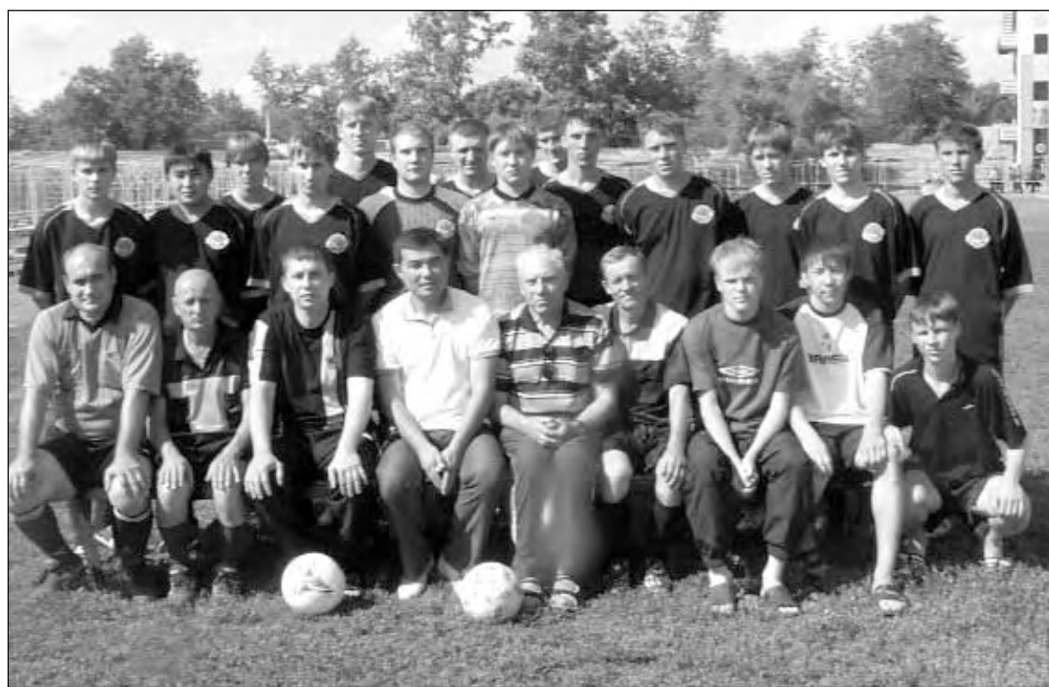
Фото после победного матча. За весь чемпионат «Аят» не проиграл ни одного матча