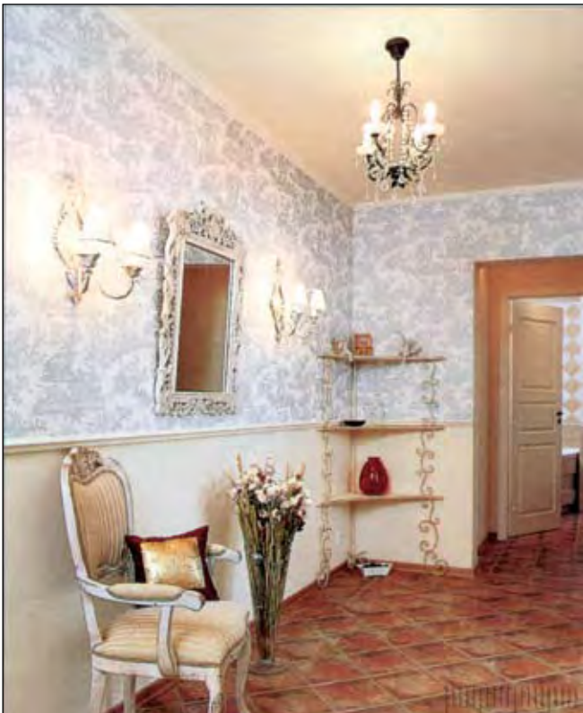
Стены в прихожей отделаны в духе классических панелей. Обои на верхней части расписаны пасторальными сценками