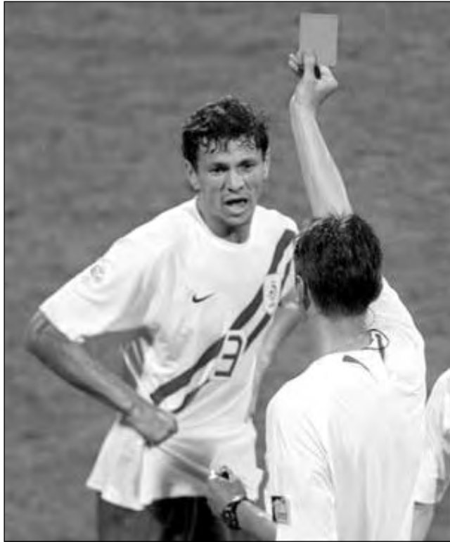
Главными «игроками» чемпионата стали судьи

ЧМ показал, что роль тренера в современном футболе нельзя ни переоценивать, ни недооценивать. В этом смысле весьма показательны наставники команд-финалистов: очень серьёзный специалист из Италии Липпи лишь в серии пенальти превзошёл своего французского оппонента Доменек, главным достоинством которого даже его собственные игроки называют неконфликтный характер. Липпи, располагавший едва ли не самой слабой «Скуадрой Адзуррой» за последние 10 лет сумел мобилизовать своих подопечных, да так, что стареющий и уже почти списанный со счетов Каннаваро стал абсолютно лучшим защитником турнира, а штатный анфан терибль сборной Тотти проявил себя сугубо командным игроком. В то же время Доменек, в те-