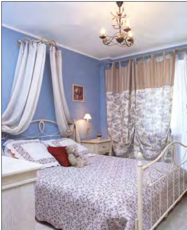
Синяя спальня с балдахином и оригинальными комбинированными шторами. Верхняя линия штор вырезана волнообразно

«Мокрую» комнату решили в том же стиле, что и спальню. Ее эстетика больше всего подходит под определение «туалетной комнаты». Под стать элегантной угловой ванне – очаровательный столик, в который вмонтирована раковина. Он сделан на заказ из деревянных полуфабрикатов – двух дубовых досок и ножек-балаясин, а затем покрашен и состарен. Зеркало над ним в деревянном витом багете также поддерживает общий стиль. Нижняя часть стен декорирована мозаикой цвета светлой охры. Верхняя часть выложена по диагонали мелкой плиткой, в которой охристая квадратная плитка, имитирующая потёртость, чередуется с такой же белой. Общая гамма – тёп-