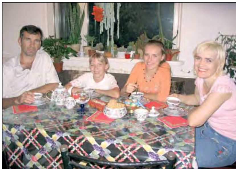
Совместное чаепитие для этой семьи – способ душевного общения