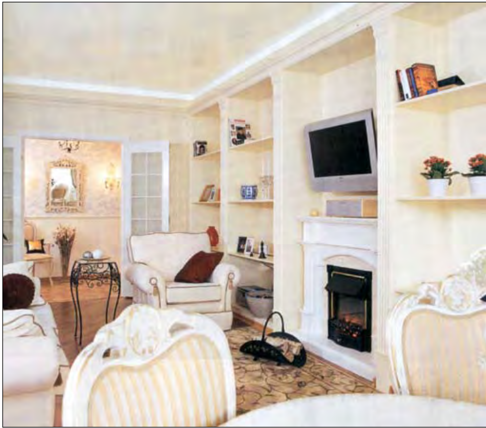
Композиция с зеркалом в прихожей позволяет «продлить» и углубить гостиную. Искусственно состаренная мебель, кованый столик, камин и стеллаж «под лепнину» делают комнату такой французской

И наконец-то чуть расширили хозяйский санузел, перенеся одну из перегородок так, чтобы в нише разместилась стиральная машина. Поскольку у хозяйки не бывает многолюдных сборищ, гостевой санузел не нужен. Поэтому на его месте у входа расположилась гардеробная. На её открытых полках предусмотрено достаточно места для