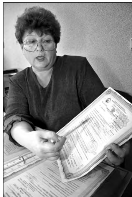
Обязательно сравните вес партии, указанный в сертификате, и вес товара, выставленного на прилавке

На базаре на мясо, овощи, фрукты, молочную продукцию домашнего производства покупатель должен потребовать акт ветсанэкспертизы, в котором важно обратить внимание на время выдачи и срок действия.