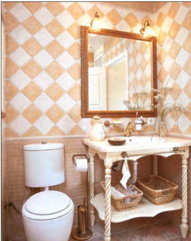
Ванная – в том же старофранцузском стиле. Столик из двух дубовых досок на резных ножках сделан на заказ

В результате оригинальная, с яркой стилистической индивидуальностью квартира вызывает восхищение, как хозяйки, так и её гостей.