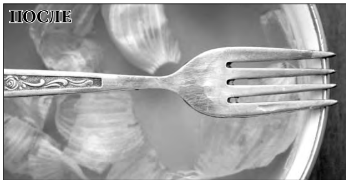
После чесночного отвара наша вилка выглядела не идеально