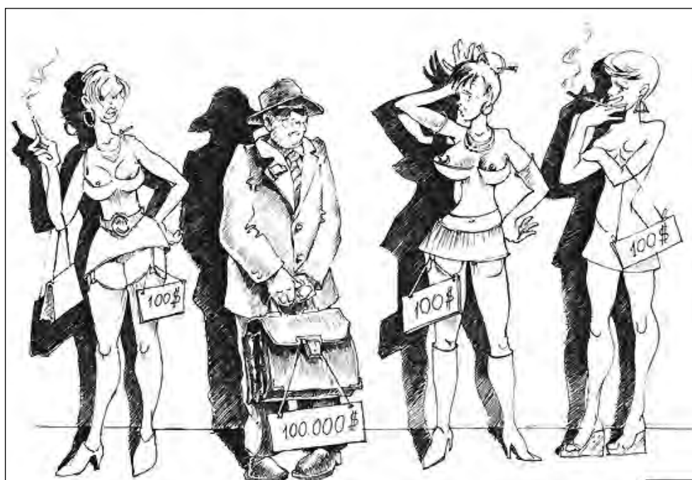
Панель (карикатура Андрея Потопальского)