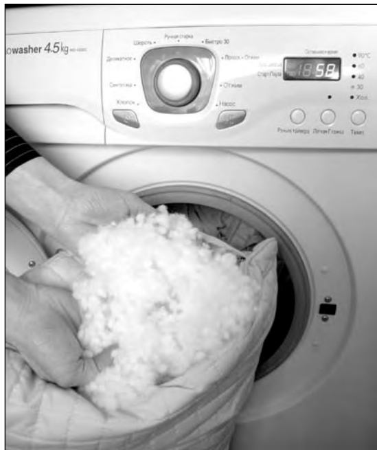
Стирать подушку из полиэстера можно даже в машине. Но – деликатно

Чтобы ответить читательнице, «НГ» обзвонила несколько костанайских химчинок. Выяснилось, что подушки с синтетическим наполнителем принимают в Костанайе лишь в прачечной по улице Абая. Как нам объяснили там, заказы на стирку таких подушек поступают довольно часто, потому что многие домохозяйки боятся стирать подушки в домашних условиях. И напрасно.