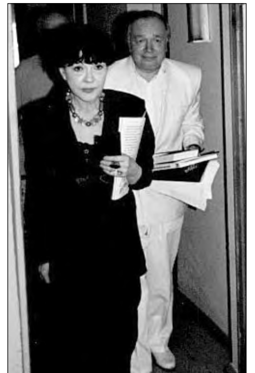
Властители дум 60-х – Ахмадулина и Вознесенский – до сих пор издают новые книги